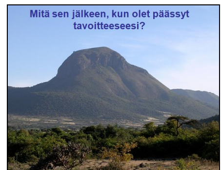
Mitä sen jälkeen, kun olet päässyt tavoitteeseesi?

Jeesus on tie, totuus ja elämä (Joh. 14:6). Ennen kuin alkuseurakunnassa kristittyjä alettiin sanomaan kristityiksi, heitä kutsuttiin "sen tien vaeltajiksi". Kun olemme Jeesus-tiellä, olemisemme on kahtalainen. Toisaalta olemme jo perillä, sillä onhan Pyhä Henki annettu sinetiksi Jumalan lapseudesta. Toisaalta olemme vielä matkalla ja Pyhä Henki on meillä matkaoppaana ja perille viejänä. Perillä olemme lopullisesti vasta sitten, kun saamme ylösnousemusruumiin Jeesuksen tullessa noutamaan omiaan.